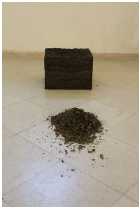
Rad Ivana Bogovića s 1 studentskog bijenala.