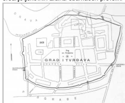
Slika 3: interpretacija plana srednjovjekovnog Osijeka, Ivan Lay 1965.

U prvom pokušaju interpretacije plana prema postojećem prostornom okviru Tvrđe, koji je u sklopu elaborata s analizom povijesnog razvoja grada za potrebe Urbanističkog plana Osijeka izradio urbanist Ian Lay 1965. (slika 3), [5] bio je tako u samo sumarno pretpostavljenoj trasi srednjovjekovnih zidina obuhvaćen preveliki prostor, a na podlozi shematski naznačene današnje ulične mreže. Osim cijelog bastiona sv. Karla,