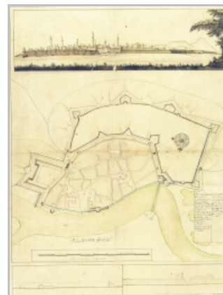
Slika 2: detalj s prikazom Velikih vrata s projekta modernizacije fortifikacija S. de Mesregnya, 1688.

Izradi plana pristupilo se nesumnjivo ubrzo nakon ulaska u prazni grad, vjerojatno još najkasnije krajem 1687., pa je plan s projektom fortifikacija mogao biti gotov i prije nego što je početkom lipnja 1688. u Osijeku počelo okupljanje glavnine carske vojske za daljnji prodor prema jugu, u dubinu tada teško uzdrmanog Osmanskog carstva, jer su prema planu morali što prije započeti pripremni radovi za gradnju Hornwerka. U Carigradu je i dalje vladao kaos i nakon smjene sultana, ali je u rujnu ubrzo nakon što je osvojen Beograd, Francuska izvela opći napad na Carstvo, čime je započeo Devetogodišnji rat , pa je glavnina carske vojske morala biti prebačena na zapad.