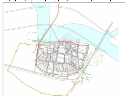
Slika 6: rektifikacija plana Osijeka iz 1688., IFU - arh. Goran Vareško i Zlatko Uzelac, 2014.

Preostaje, međutim, još za arheološko istraživanje i prostor trećeg najvažnijeg elementa urbane strukture srednjovjekovnog Osijeka, a to je kompleks nekadašnjih glavnih gradskih vrata, koja su stajala u jugoistočnom kraju utvrđenog grada, na mjestu kasnijeg bastiona sv. Inocenta. Tek arheološkim utvrđivanjem njihovog točnog položaja bit će otvorene pretpostavke i za konačnu precizniju rektifikaciju plana.