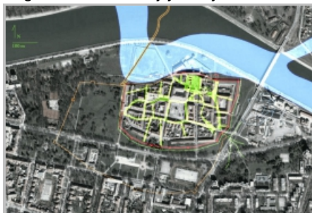
Slika 5: rektifikacija plana Osijeka iz 1688., arh. Danijan Uzelac i Zlatko Uzelac, 2009.

izradili smo jedan pokušaj sumame, digitalne rektifikacije 2009. (slika 5) [10] i u nastavku njegovu dopunu 2015. (slika 6). [11] Digitalne karte predstavljaju analitičku podlogu, koju je moguće dopunjavati različitim novim podacima, posebno eventualnim novim arheološkim nalazima koji se mogu očekivati kroz daljnja usmjerena ili eventualna zaštitna arheološka istraživanja.