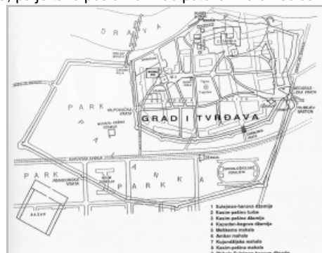
Slika 4: interpretacija plana Osijeka iz 1688., RZOS 1976.

Za potvrđivanje svih informativnih vrijednosti plana i njegove iznimne važnosti za analizu Osijeka u osmanskome, ali i srednjovjekovnom razdoblju presudna je prije svega njegova što točnija rektifikacija (ispravka geometrijskih deformacija analiziranog plana). Danas je ona dodatno olakšana rezultatima nekoliko arheoloških istraživanja, koji se mogu pridružiti onim elementima plana za koje možemo sa sigurnošću pretpostaviti da se odnose na prostorne konstante, odnosno na pouzdano utvrđene točke u prostoru povijesnog grada. U tu svrhu