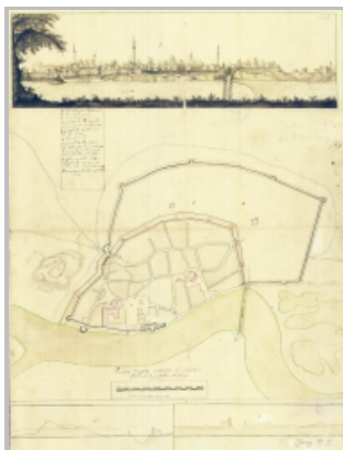
Slika 1: plan grada iz 1688., S. de Mesregny

Ključne riječi: Osijek, srednjovjekovni Osijek, barokni gradovi-tvrđave, Mathias von Kaiserfeld, J. Petis de la Croix