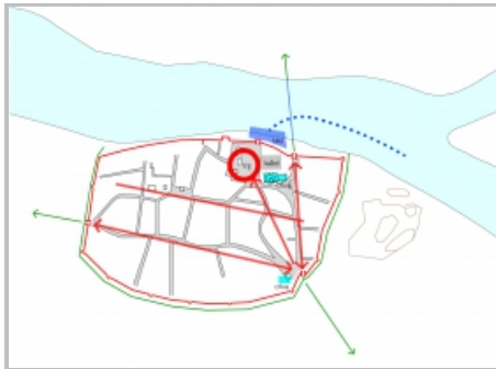
Slika 7: shema urbane strukture srednjovjekovnog Osijeka, IFU – arh. Goran Vareško i Zlatko Uzelac, 2014.

nekoliko džamija (ukupno njih pet, tri u starom dijelu grada i dvije u Palanci), uz koje se pred onima u staroj jezgri očituju manja ili veća ulična proširenja (vidi slika 6). Iako je ulična mreža zacijelo prikazana s manje potrebne pouzdanosti