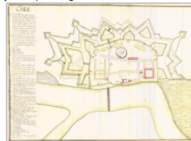
Slika 9: drugi plan Osijeka Mathiasa von Kaiserfelda 1693.

U daljnjoj razradi projekta za Osijek, koja je uslijedila dvije godine kasnije, Mathias von Kaiserfeld je još prije svoje pogibije u opsadi Beograda 1693., izradio novi projekt, koji osim ispravaka nekoliko pogreški u prvom projektu fortifikacija donosi i osnovnu shemu ulične strukture kao i položaje niza budućih vojarni i drugih građevina koji će transformirati grad u barokni grad-tvrđavu, a donosi i naznaku prijedloga da u središtu grada treba postaviti "Parade Platz" (slika 9). Glavna promjena u uličnoj strukturi izazvana je premještanjem kopnenih gradskih vrata na novi položaj. Kaiserfeld je predložio uspostavljanje ulice od kopnenih Novih vrata izravno prema Vodenim vratima, a samo je okvirno naznačio najvažnije postojeće elemente urbane strukture s karakterističnim dvjema paralelnim ulicama u pravcu istoka i zapada. One su shematski označene kao geometrijski ispravljene, a naznačene su samo neke od poprečnih ulica.