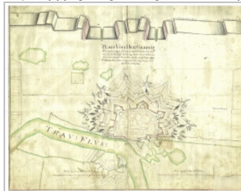
Slika 11: drugi plan Osijeka ing. J. Petis de la Croixa, 1713.

Uz manje kasnije izmjene koje će uslijediti gradnjom nove isusovačke župne crkve sv. Mihovila i formiranjem manjeg trokutastog trga pred pročeljem, gradnjom nove Glavne straže, ne na sredini trga, nego na njegovoj zapadnoj regulaciji i sl., taj je plan konačno odredio izgled barokiziranog grada-tvrđave. Nakon 1713. njegovu će realizaciju preuzeti ing. Johann Friedrich von Heysse, koji će pune 22 godine, sve do smrti u Osijeku 1736. biti glavni graditelj Osijeka.