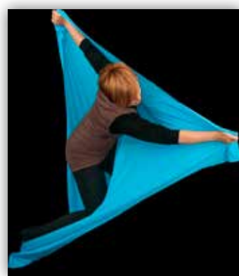
Terapija pokretom i plesom