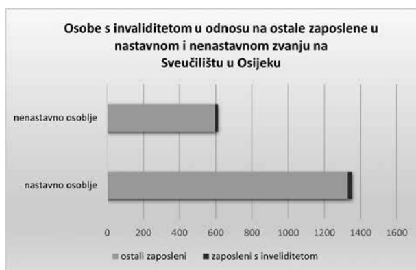
Prikaz 2. Osobe s invaliditetom u odnosu na ostale zaposlene u nastavnom i nenastavnom zvanju na Sveučilištu Josipa Jurja Strossmayera u Osijeku

Najviše je zaposlenih osoba s invaliditetom na Građevinskom i arhitektonskom fakultetu Osijek (deset), zatim slijedi Fakultet agrobiotehničkih znanosti Osijek (osam), Filozofski fakultet Osijek (četiri), po tri zaposlene osobe s invaliditetom rade na Fakultetu elektrotehnike, računarstva i informacijskih tehnologija Osijek, Fakultetu za dentalnu medicinu i zdravlje Osijek i Pravnom fakultetu Osijek, po dvije na Ekonomskom fakultetu u Osijeku, Medicinskom fakultetu Osijek, Prehrambeno-tehnološkom fakultetu Osijek i Akademiji za umjetnost i kulturu u Osijeku, dok je po jedna zaposlena osoba s invaliditetom na Katoličkom bogoslovnom fakultetu u Đakovu i Odjelu za biologiju.