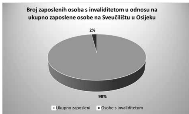
Prikaz 1. Broj zaposlenih osoba s invaliditetom u odnosu na ukupno zaposlene osobe na Sveučilištu Josipa Jurja Strossmayera u Osijeku